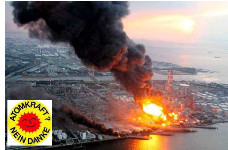
사진: 일본 후쿠시마 원전사고 2011