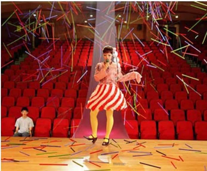
Wonderland I want to be a singer